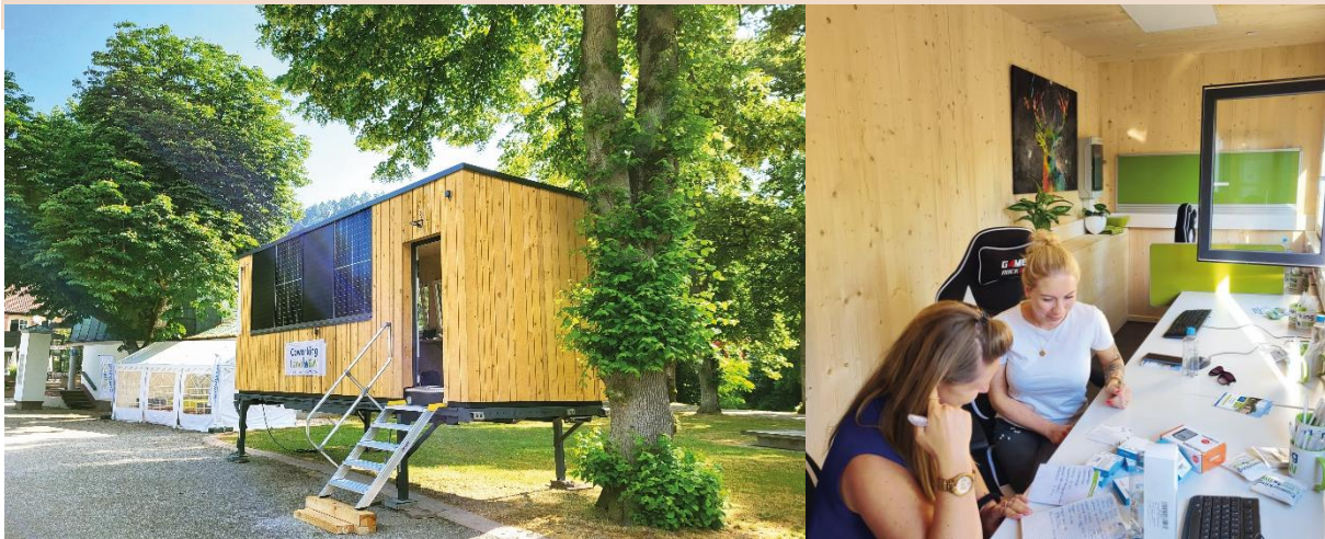
Der „KoKubus“ als Beispiel für ein mobiles Pop-up-LandBüro (Außen- und Innenansicht)