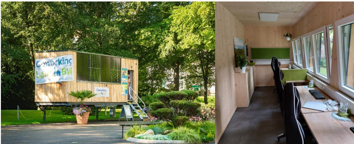
Der „KoKubus“ als Beispiel für ein mobiles Pop-up-LandBüro (Außen- und Innenansicht)

Alle neuen LandBüros sind aber gut beraten, eine Testphase durchzuführen, bevor kostenintensive Investitionen in den Aufbau eines LandBüros getätigt werden. Eine Testphase erlaubt es, Kontakt zur Zielgruppe aufzubauen und diese auch direkt nach ihren Wünschen und Verbesserungsvorschlägen zu befragen. Dafür kann beispielsweise ein Pop-up-LandBüro eingerichtet werden, wie es z.B. der Weidenhof im Jahr 2024 getan hat. Wo eigene Räumlichkeiten fehlen, besteht die Möglichkeit mobile Arbeitscontainer wie den „KoKubus“ von Kommune Zukunft zu mieten, um die Akzeptanz des geplanten Angebots zu testen. Als Irritationspunkt schafft ein solcher Arbeitscontainer Aufmerksamkeit für das Projekt und weckt die Neugier der Menschen vor Ort.